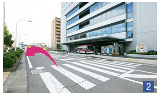
ホテル前を通過し、突き当たりを左折