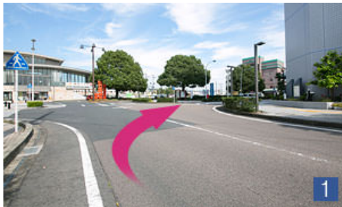
美濃太田駅ロータリー手前を右折