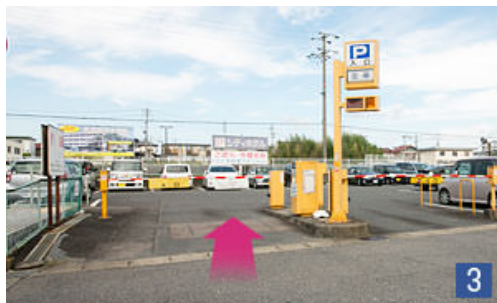
左折後、直進すると第一駐車場 第一駐車受手前を右折後、左手に 第二駐車場